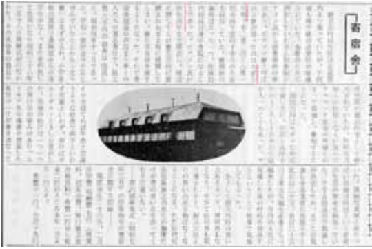
北見北斗高等学校 同窓会報 第2号 昭和42年3月12日発行

【編集者よりの訂正】 大正十五年とあるが大正十三年が正。 昭和四年とあるが昭和三年が正。