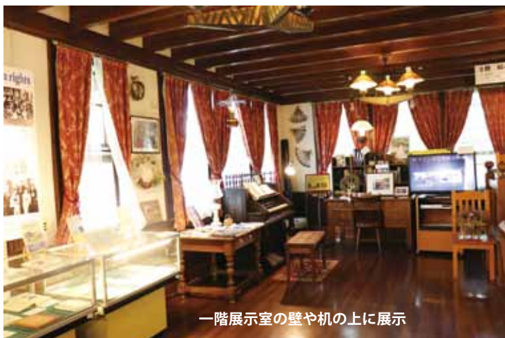
一階展示室の壁や机の上に展示

主だった作品をご紹介します。これらは、まだ展示していませんので、ピアノン記念館に足を運んでいただけましたらご覧いただけます。