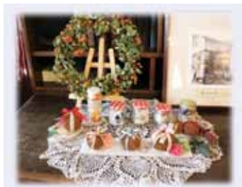
モイストポプリなど小物も展示