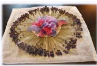
「香りを編む」(ハーブ部会の共同制作)