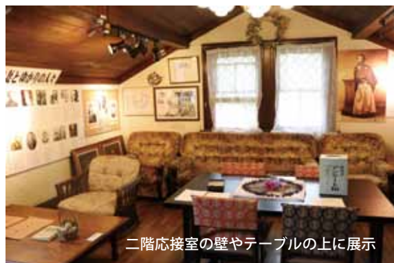
二階応接室の壁やテーブルの上に展示