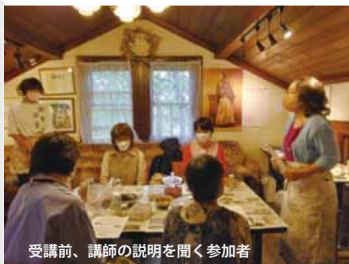
受講前、講師の説明を聞く参加者

昨年の9月に予定した「モイストポプリ講習会」はコロナ禍での臨時休館により中止になってしまいました。しかし本年は9月14日水曜日に予定通り開催する事ができました。従来からの講習会は週末の土・日実施でしたが、今回初めて平日開催を試みました。結果的には、土日には参加が難しい方で、当記念館講習は初参加の方ばかりの受講でした。今後、年に一度は平日講習会も必要のように思われます。 午前午後と、和気藹々に思い思いの香りをブレンドしたモイストポプリを作りあげました。